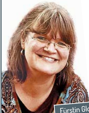
„Fürstin Gloria Palais“

„Kanzleisitz Änderung seit 1. April 2022 von Neutraubling nach Regensburg“