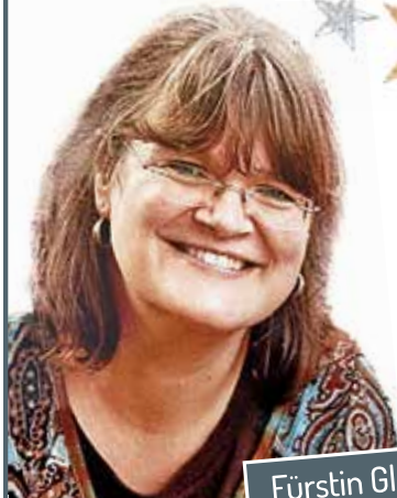
„Fürstin Gloria Palais“

Wir wünschen ein frohes Weihnachtsfest und ein gutes neues Jahr 2023.