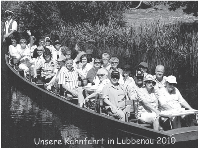
Unsere Kahnfahrt in Lübbenau 2010

Bei herrlichem Wetter starteten wir mit einem Bus der Fa. Piendl zu unserer 4-Tagesfahrt in die Niederlausitz. 1. Station war die Stadt Meißen, „die Wiege Sachsens“ genannt, wo eine Führung in der Porzellanmanufaktur angesagt war. In der Schauwerkstatt konnte man den Künstlern über die Schulter schauen.