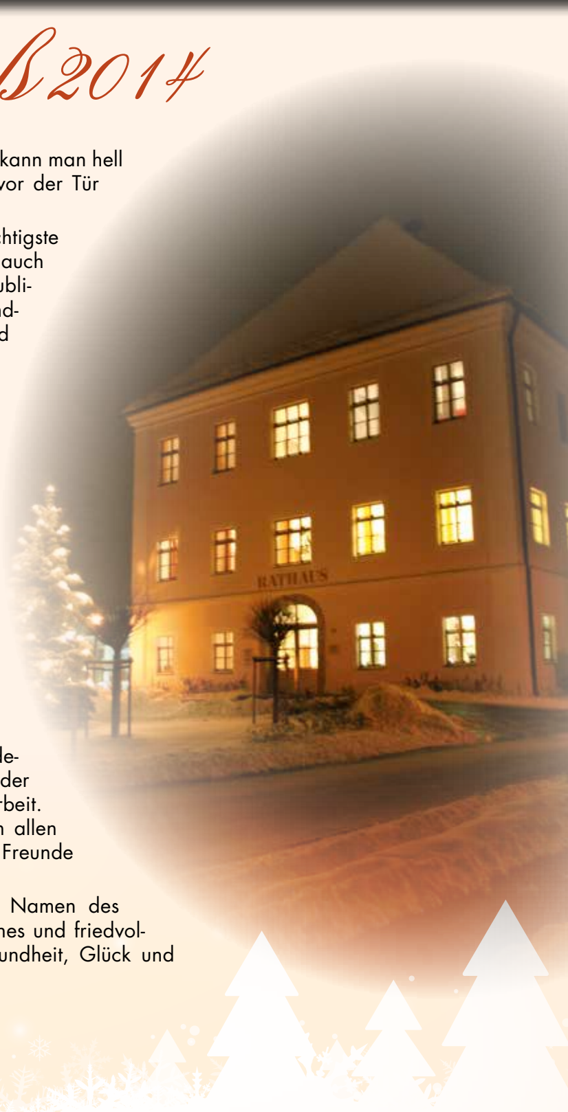
Hans Thiel - 1. Bürgermeister