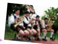
Es unterhält Sie die Blaskapelle „De Usern“

11:30 Uhr Segnung des neu gestalteten Dorfplatzes mit Kirchenumfeld